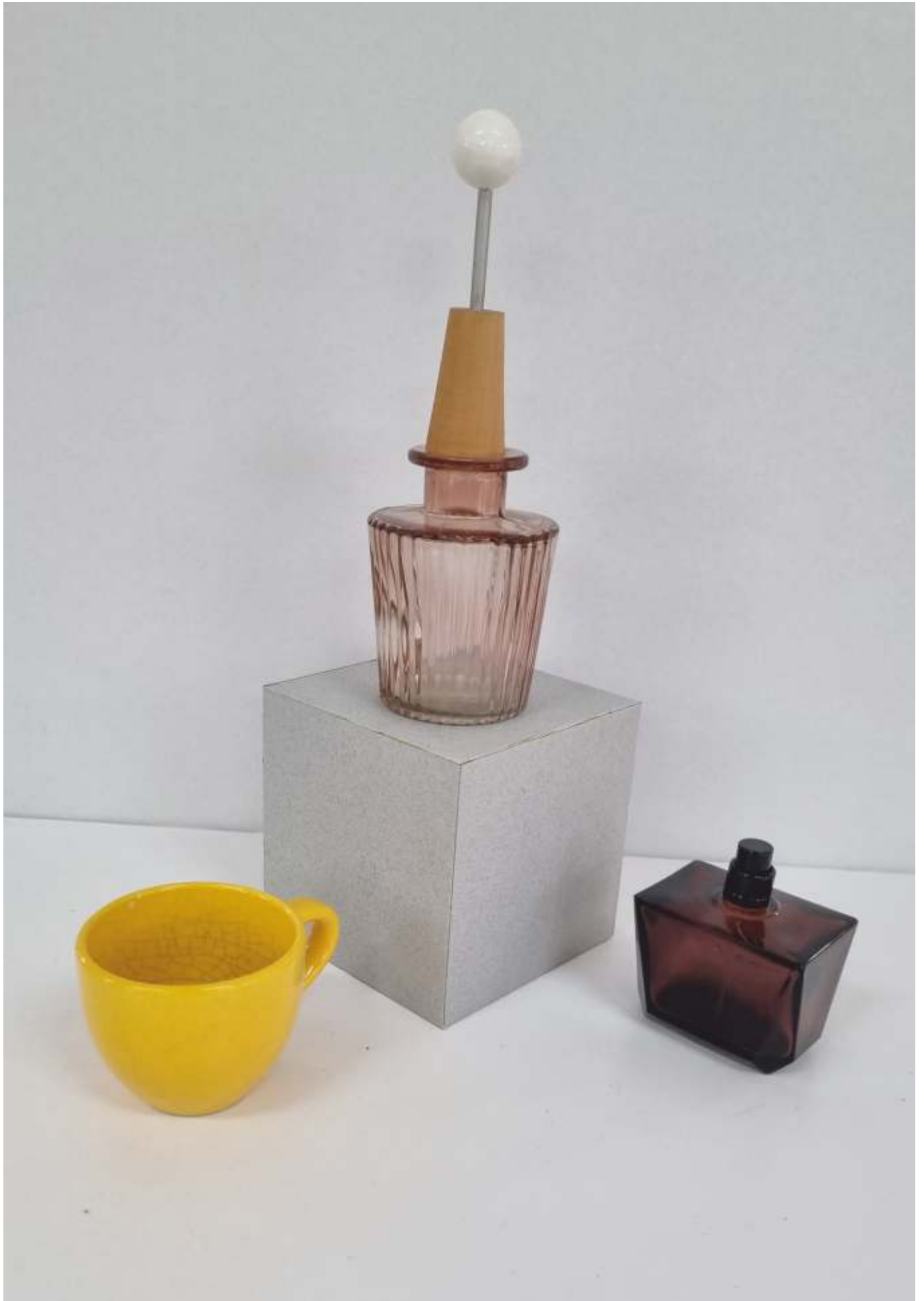
varianta 4 propusă de comisia de admitere pentru studiul cromatic