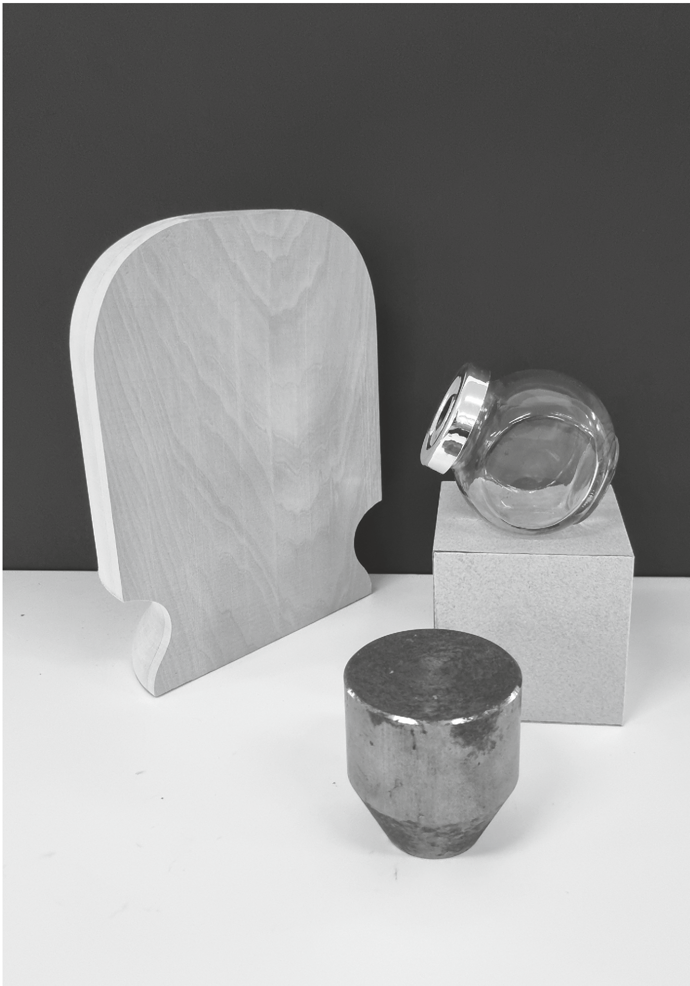
varianta 5 propusă de comisia de admitere pentru studiul de desen