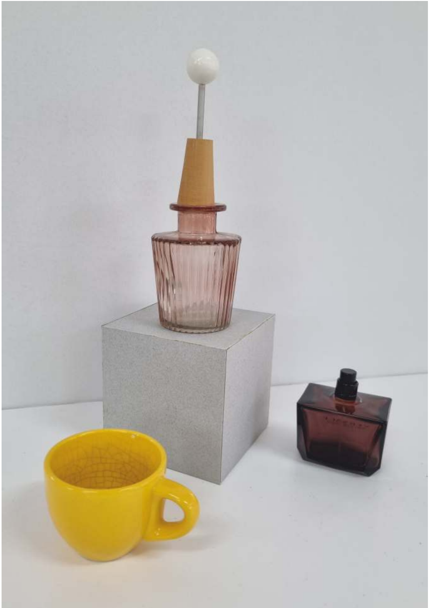
varianta 5 propusă de comisia de admitere pentru studiul cromatic