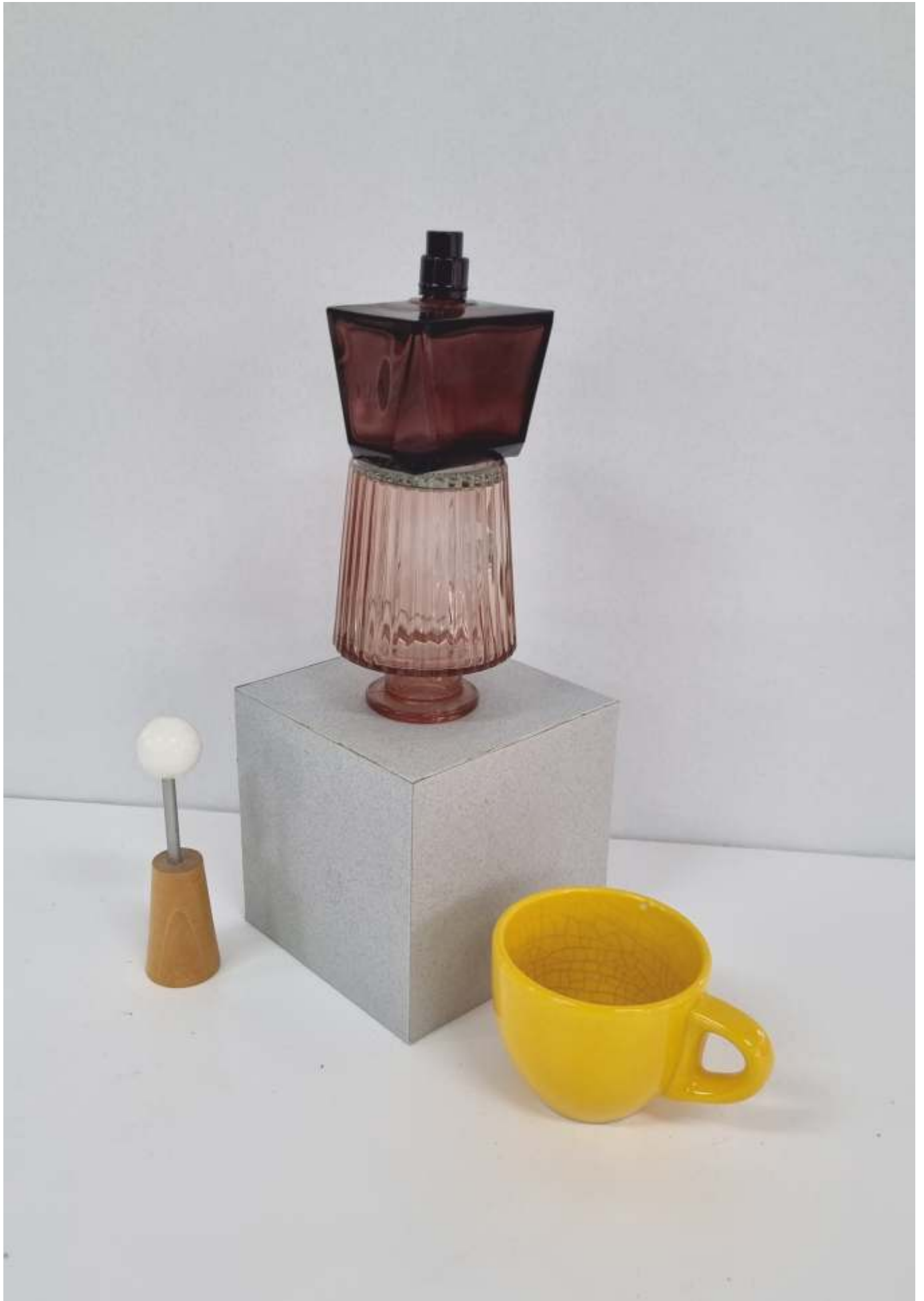
varianta 7 propusă de comisia de admitere pentru studiul cromatic