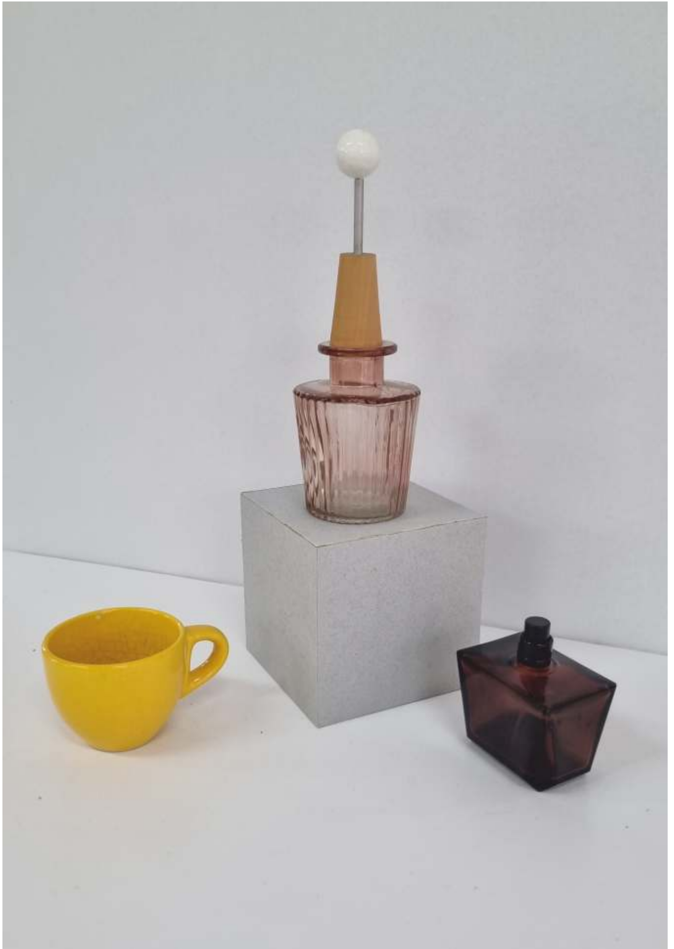
varianta 6 propusă de comisia de admitere pentru studiul cromatic