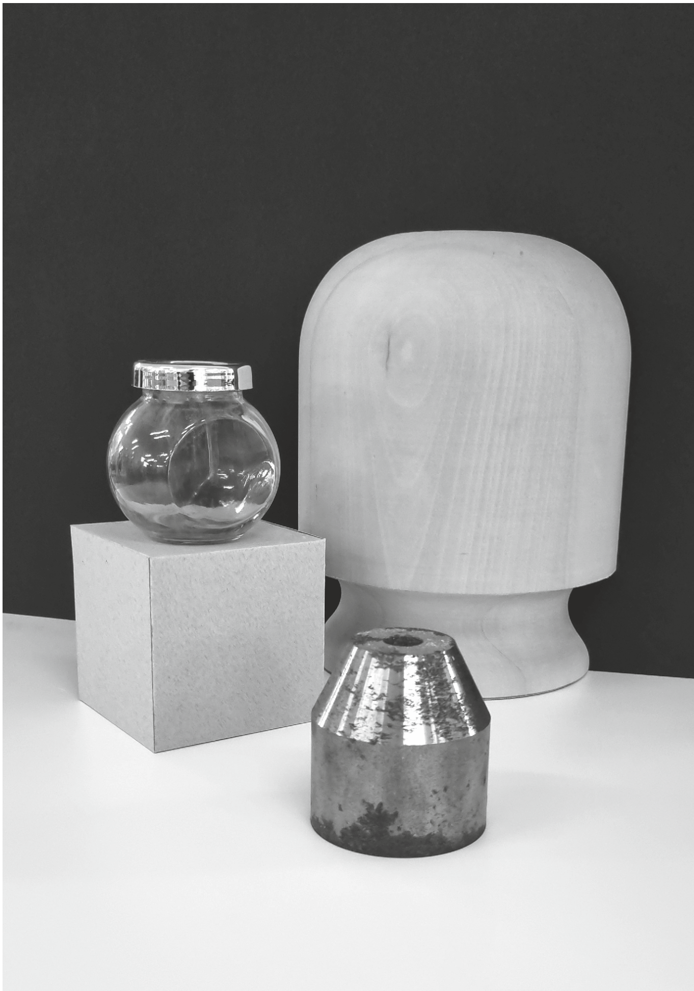
varianta 3 propusă de comisia de admitere pentru studiul de desen