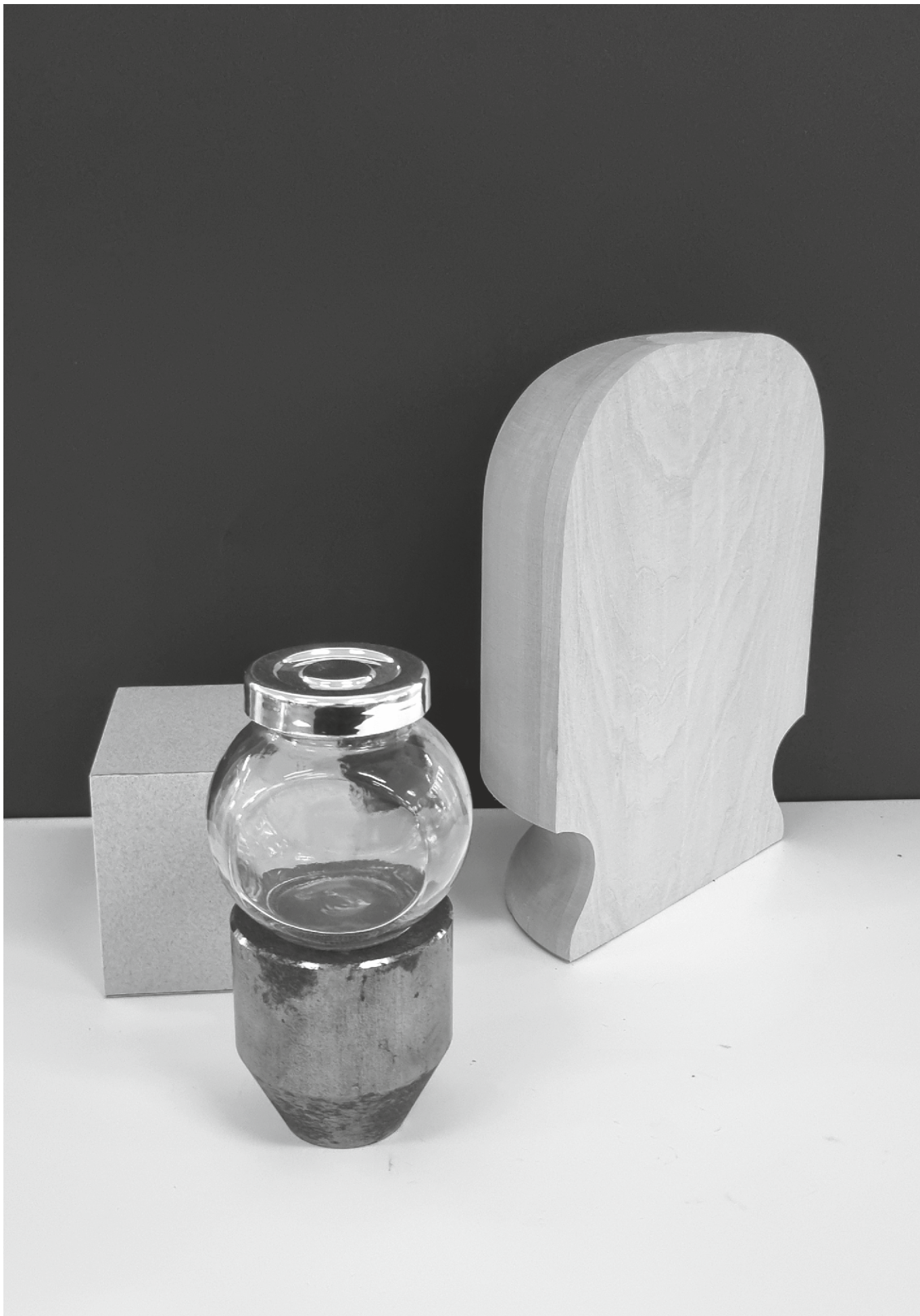
varianta 7 propusă de comisia de admitere pentru studiul de desen