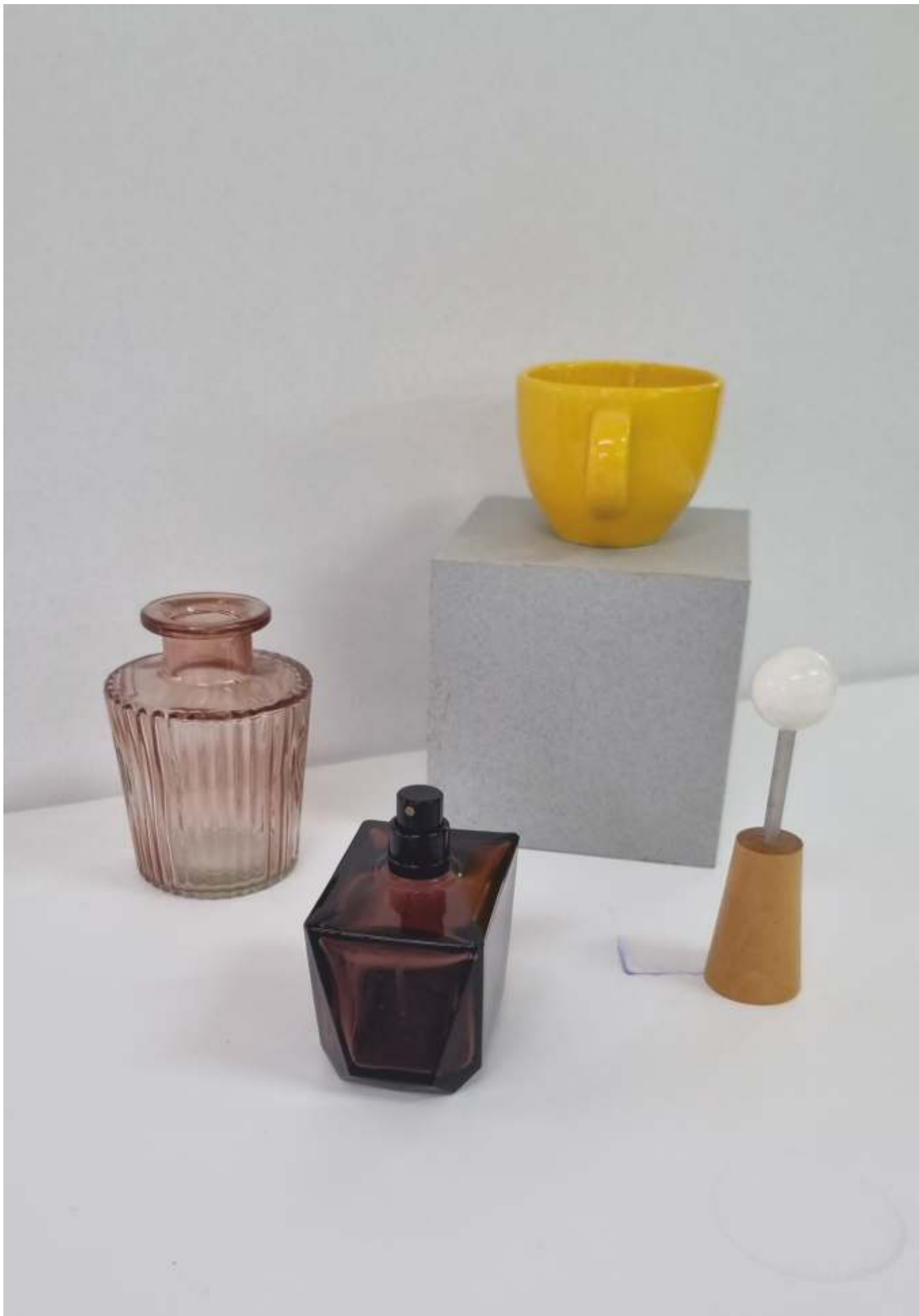
varianta 3 propusă de comisia de admitere pentru studiul cromatic