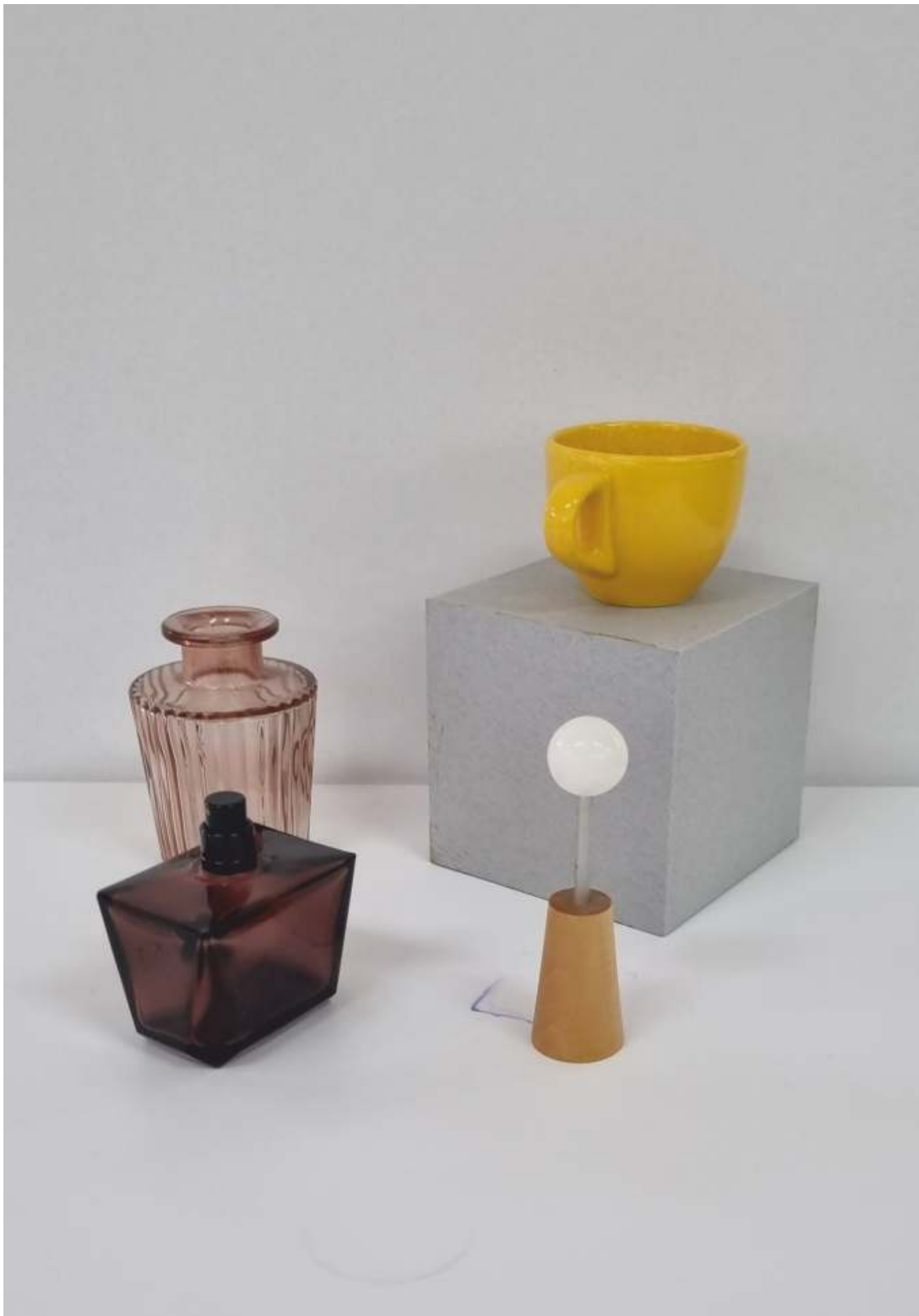
varianta 1 propusă de comisia de admitere pentru studiul cromatic