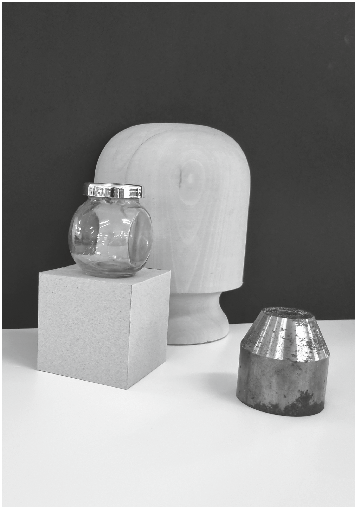
varianta 2 propusă de comisia de admitere pentru studiul de desen