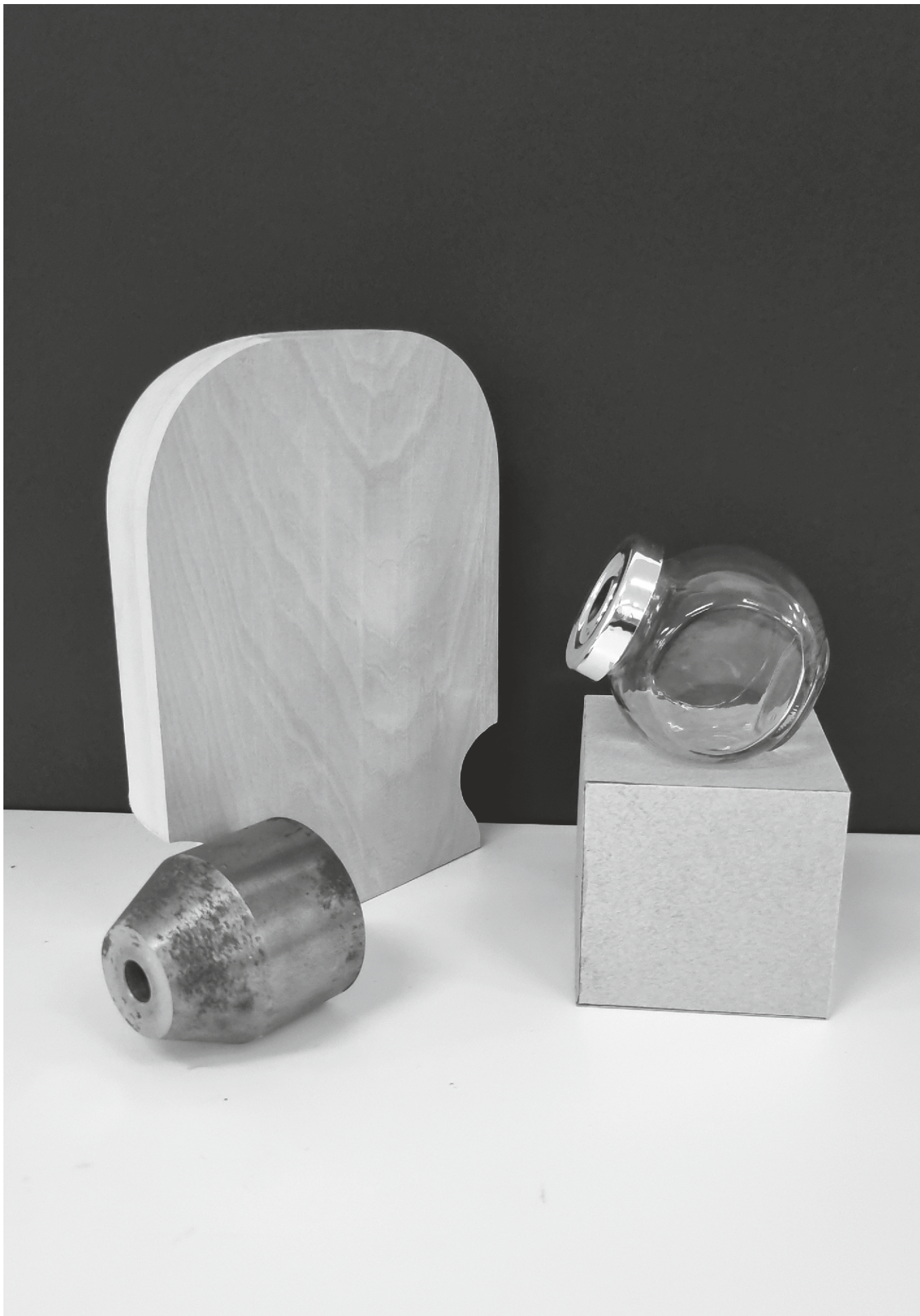
varianta 4 propusă de comisia de admitere pentru studiul de desen