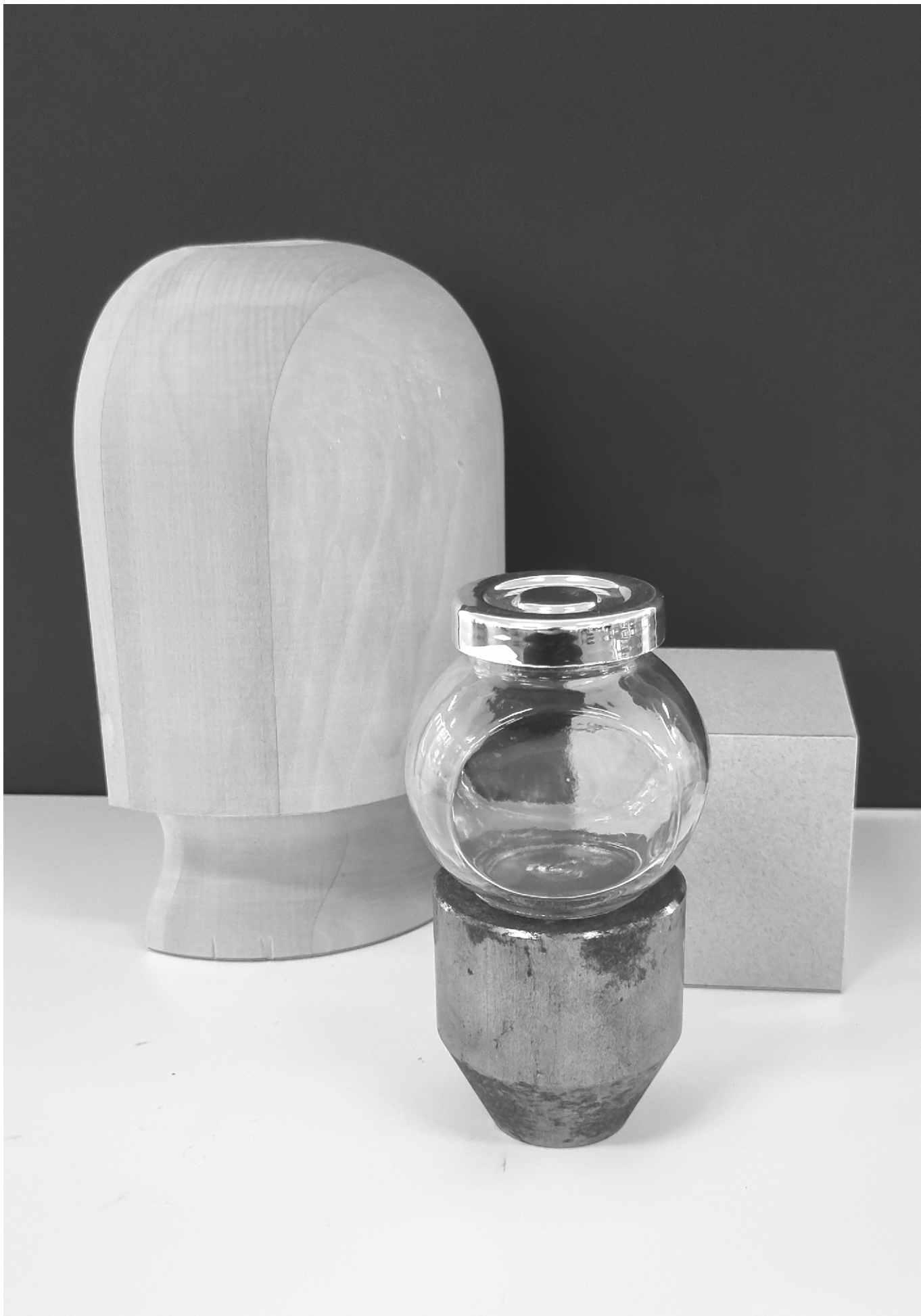
varianta 6 propusă de comisia de admitere pentru studiul de desen