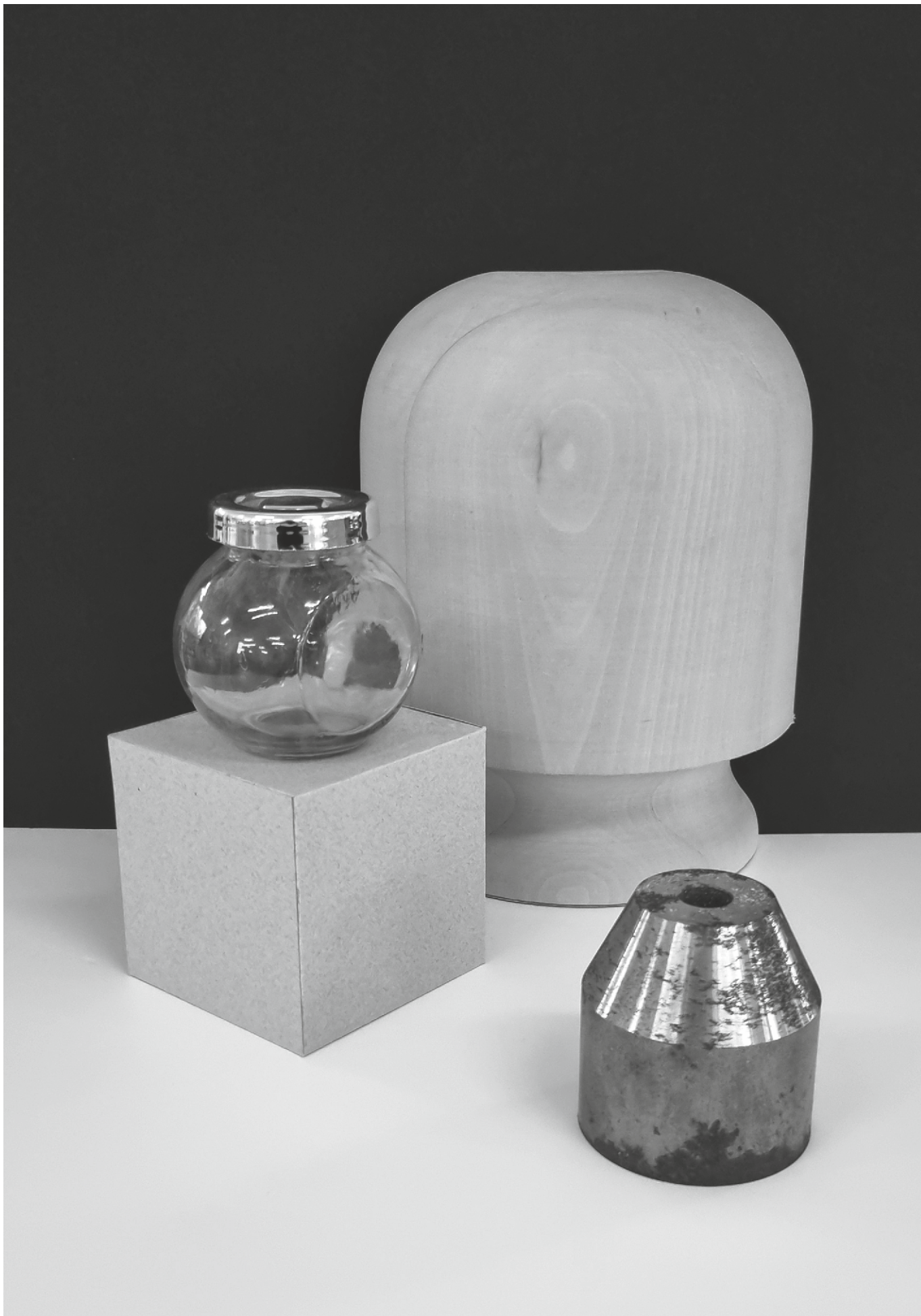
varianta 1 propusă de comisia de admitere pentru studiul de desen