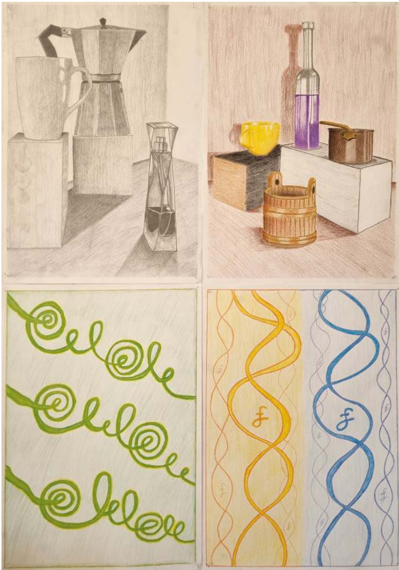
exemplu de set cu cele 4 lucrări din portofoliul de admitere