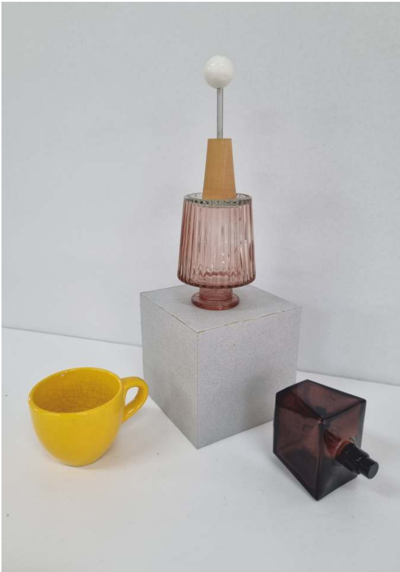
varianta 7 propusă de comisia de admitere pentru studiul cromatic