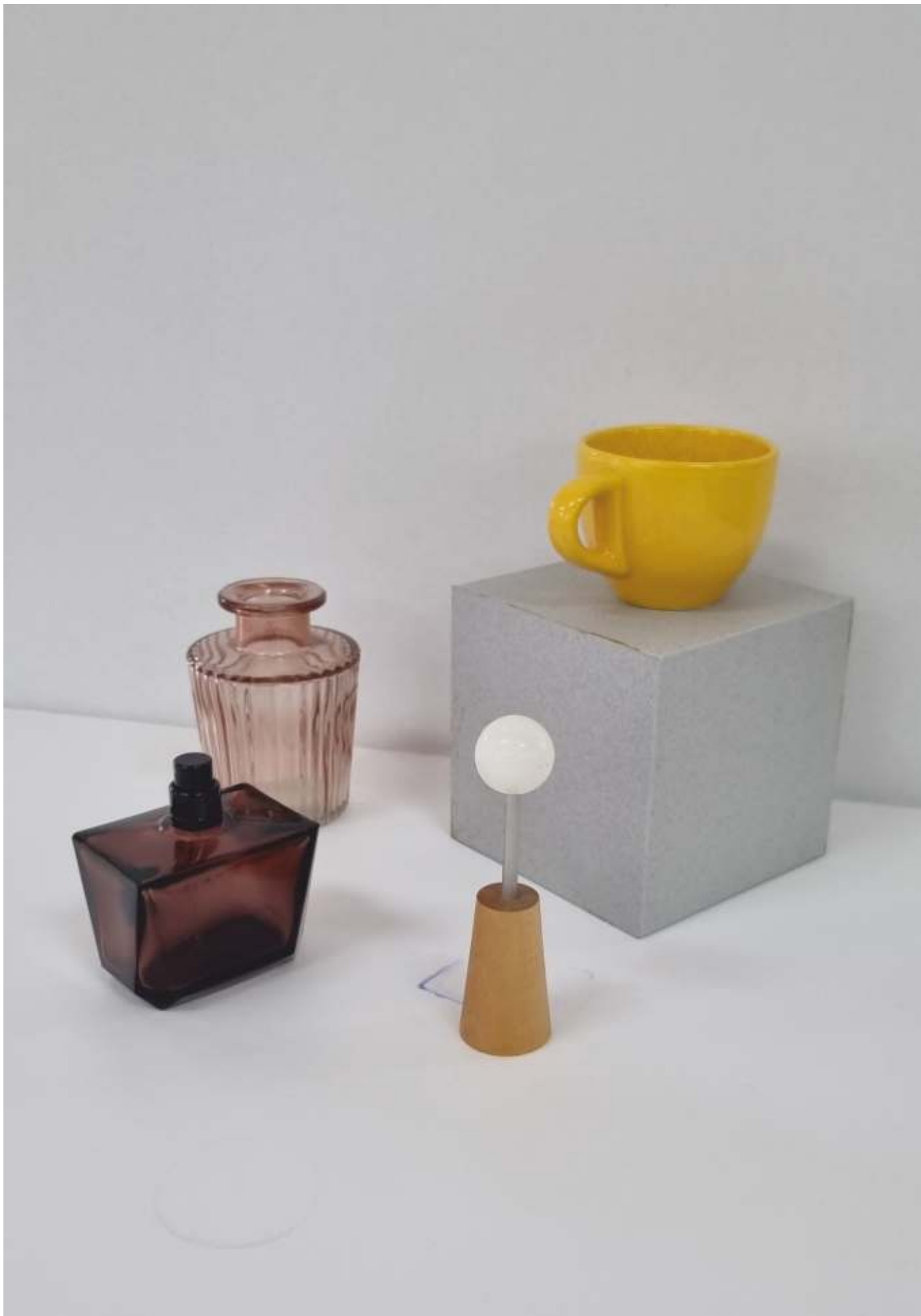
varianta 2 propusă de comisia de admitere pentru studiul cromatic