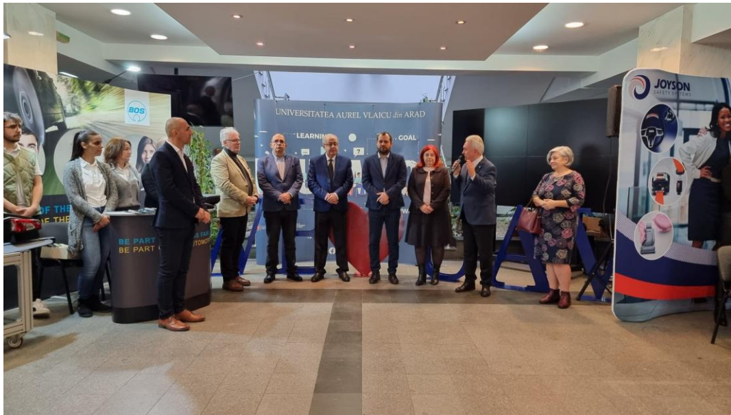
41. Întâlnire cu angajatorii și Universitatea „Aurel Vlaicu” din Arad