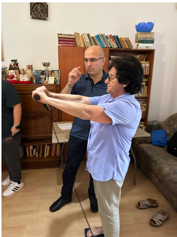
26. Training Facultatea de Educație Fizică și Sport Anul II