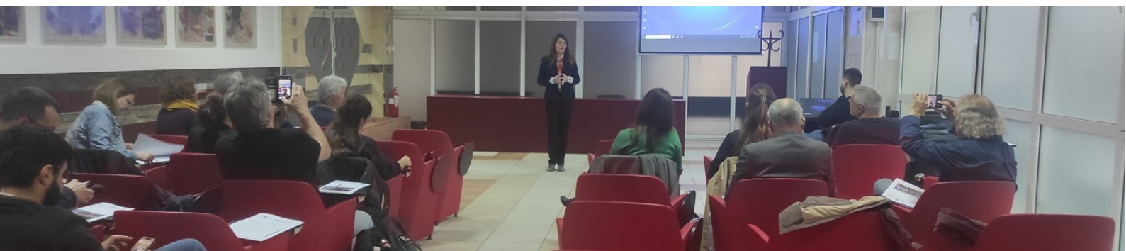
Lucrătorii de sprijin de la egal la egal: cadre de competențe și atitudini Proiectul ERASMUS TUTO3