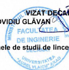
Tabel nominal cu studenții Facultății de Inginerie care beneficiază de bursă de merit I, merit II și socială la programele de studii de licență pe sem I - an universitar 2018 - 2019